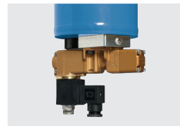
Opción: válvula de cierre del aire de barrido

depende entre otras cosas del punto de rocío por presión deseado. En la serie HMM el conjunto de membrana se aloja en una caja resistente a la presión. Esta ejecución ofrece la posibilidad de interrumpir el flujo de aire de barrido y aumentar así notablemente la rentabilidad. Una válvula electromagnética opcional, montada para ello, puede ser abierta y cerrada por el contacto de marcha del compresor.